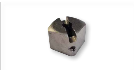
Benodigd voor AT045U-AT101U, A coating: AS adapter (art. 80001171000001)