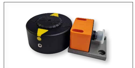
AT351-801 met standaard puck IFM IND direct gemonteerd + montage plaat (art. 800011711003)