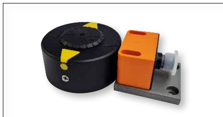
AT351-801 met standaard puck IFM IND direct gemonteerd + montage plaat (art. 800011711003)