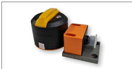
AT051-301 met IFM 53 (8002142120004) IFM IND P&F F25 direct gemonteerd* + montage plaat (art. 800011711003)