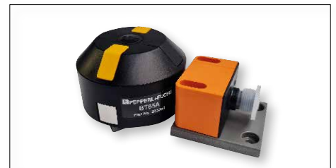
AT051-501 met BT65A (8002342220065) IFM IND direct gemonteerd* + montage plaat (art. 800011711003)