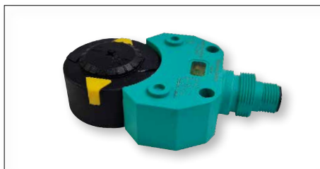
AT051-301 met standaard puck: P&F F25 direct gemonteerd*