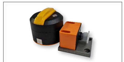
AT051-301 met IFM 53 (8002142120004) IFM IND P&F F25 direct gemonteerd* + montage plaat (art. 800011711003)