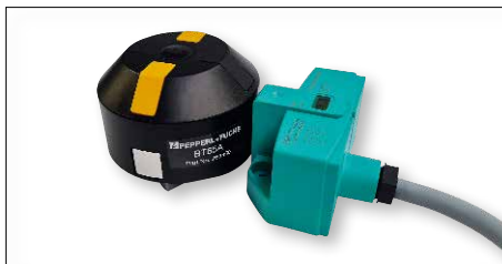
AT051-501 met BT65A (8002342220065) P&F F31 direct gemonteerd*