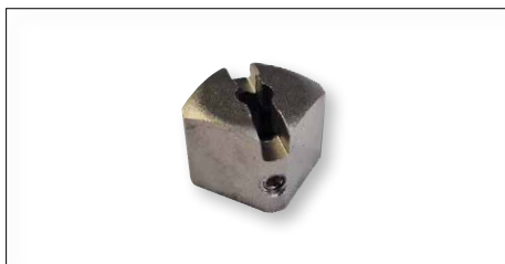
Benodigd voor AT045U-AT101U, A coating: AS adapter (art. 80001171000001)