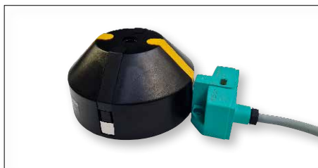
AT551-801 met BT115A (8002342220115) P&F F31 direct gemonteerd*