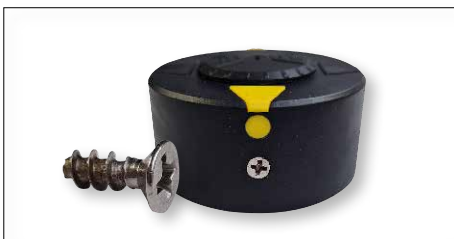
Voor alle Air torque pucks benodigd 2X RVS SCHROEF 45319