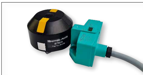
AT051-501 met BT65A (8002342220065) P&F F31 direct gemonteerd*