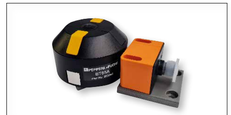
AT051-501 met BT65A (8002342220065) IFM IND direct gemonteerd* + montage plaat (art. 800011711003)