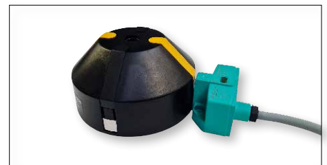
AT551-801 met BT115A (8002342220115) P&F F31 direct gemonteerd*